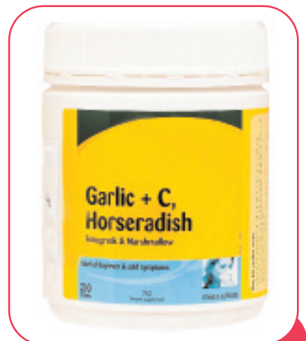
Παραδείγματα από φυτικά παρασκευάσματα

Η "παραδοσιακή χρήση" δεν ισχυριζόμαστε, με αποτελεσματικότητα, όπως αποδείχθηκε, από τις αρνητικές αποφάσεις της EFSA, για την πρώτη σειρά των ισχυρισμών για σκευάσματα βοτάνων. Αν και η χρήση αυτών των ισχυρισμών είναι, ευρέως διαδεδομένη, στην Ευρωπαϊκή Ένωση, η αποτελεσματικότητά τους δεν υποστηρίζεται, από επιστημονικά δεδομένα. Εάν επιτραπεί η διαφορετική αντιμετώπιση, θα αντιμετωπίσουμε τον κίνδυνο όλοι οι ισχυρισμοί, για τρόφιμα, που μέχρι σήμερα αξιολογήθηκαν και απορρίφθηκαν, από την EFSA, γιατί δε συνοδεύονταν, από αποδεικτικά