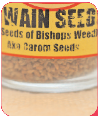
Παραδείγματα από φυτικά παρασκευάσματα

Ευρωπαϊκή Αρχή Ασφάλειας Τροφίμων (EFSA). Το 2010, η EFSA ανακοίνωσε την αξιολόγηση 44 ισχυρισμών, για σκευάσματα βοτάνων. Και οι 44 ισχυρισμοί