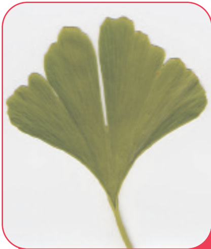
Γκίγκο το δίλοβο

Το εκχύλισμα φύλλων γκίγκο του δίλοβου, όπως ισχυρίζεται μία πορτογαλέζικη ιστοσελίδα, μέσω της οποίας μπορούμε να το αγοράσουμε, μπορεί να επιβραδύνει την εξέλιξη της νόσου Αλτσχάϊμερ και να βελτιώσει την ποιότητα ζωής των ασθενών.