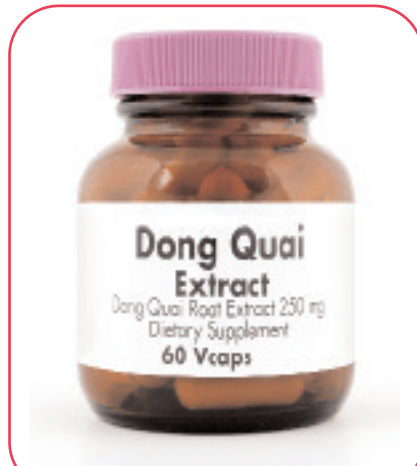
Παραδείγματα από φυτικά παρασκευάσματα

Η Ευρωπαϊκή Ομοσπονδία Καταναλωτών (BEUC) και το Κέντρο Προστασίας Καταναλωτών (ΚΕ.Π.ΚΑ) δε βλέπουμε καμία δικαιολογία, για τη διαφορετική μεταχείριση των ισχυρισμών, για τα σκευάσματα βοτάνων και προειδοποιούμε, για κινδύνους, που ενέχει η μη αυστηρή επιστημονική αξιολόγηση, που, σήμερα, αποτελεί τον κανόνα. Εάν, λοιπόν, αντιμετωπιστούν, με διαφορετικό τρόπο, οι ισχυρισμοί, για τα βότανα, θα υποβαθμιστεί η προστασία των