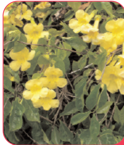
Νύχι της γάτας (cat's claw)

έμμεσα, γερμανική ιστοσελίδα, μέσω της οποίας μπορούμε να αγοράσουμε, βοηθά, στην καταπολέμηση του καρκίνου.